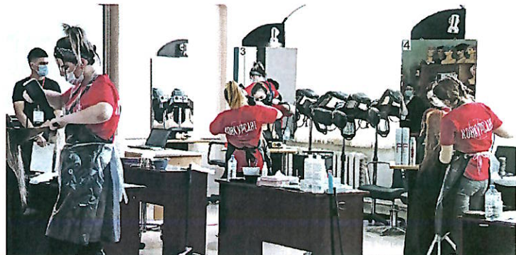
Региональный этап Всероссийского чемпионата проходит на 18 площадках по всей Тульской области.