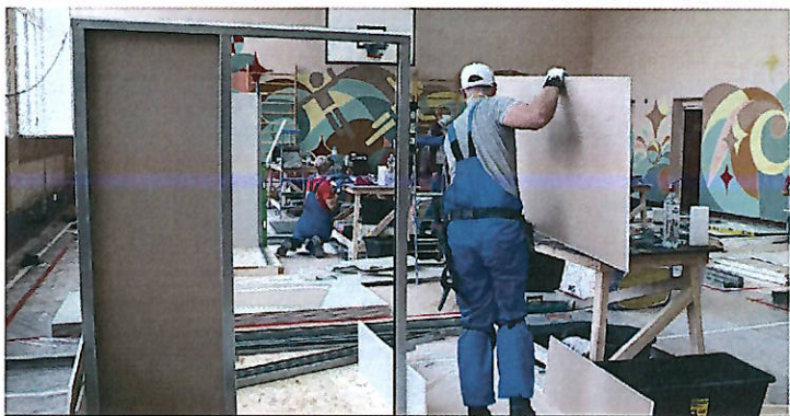
В региональном чемпионате «Молодые профессионалы» (WorldSkills Russia) принимают участие 199 человек.

ледж строительства и отраслевых технологий»: «Графический дизайн», «Сухое строительство и штукатурные работы», «Сварочные технологии», «Технологии моды», «Облицовка плиткой», «Парикмахерское искусство».